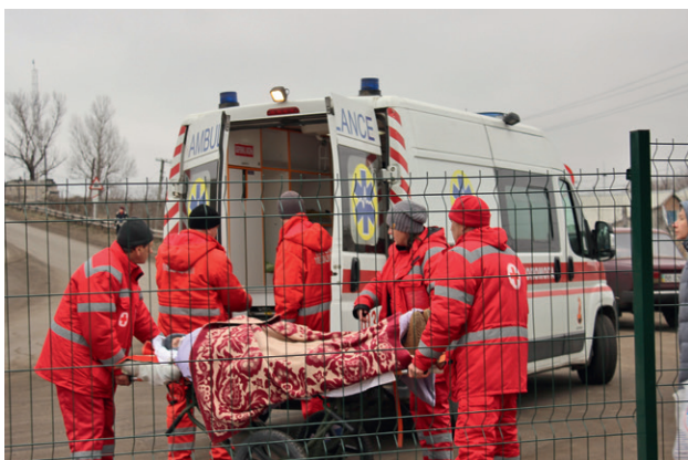
КПВВ Станица Луганска, Луганская область

малотоннажных автомобилей. Сама инфраструктура КПВВ была расширена, открылись новые окна пограничного контроля: в день посещения КПВВ мониторинговой миссией около 20 окон работали на выход с подконтрольных на неподконтрольные территории, и такое же количество – на вход с неподконтрольных на подконтрольные территории. Была также заасфальтирована дорога, ведущая от КПВВ до отремонтированной части моста. В часы работы КПВВ, автобус, а также два электрокара, предоставленных УВКБ ООН, циркулируют на данном участке и бесплатно подвозят маломобильных людей, тех, кому сложно идти пешком около 800 метров от украинского КПВВ до моста. Граждане, пересекающие по мосту линию соприкосновения в момент визита мониторинговой миссии, единогласно отмечали улучшение условий.