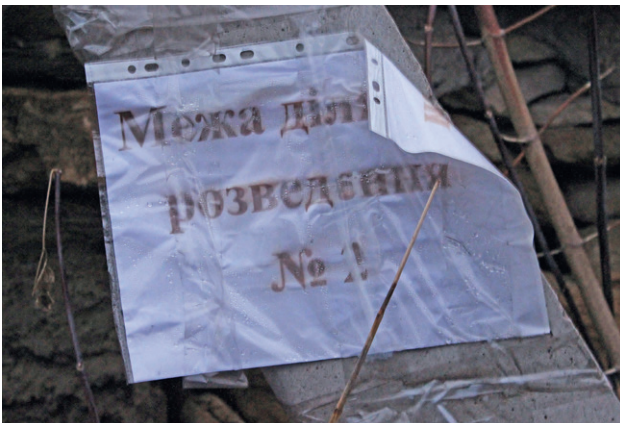
Так информируют жителей. Участок разведения сторон №2 в Катериновке, Луганской области

В Станице Луганской зона разведения сил расположена по обе стороны природного барьера — реки Северский Донец. Она включает в себя территорию единственного функционирующего в Луганской области контрольно-пропускного пункта въезда и выезда (КПВВ) «Станица Луганская», а также части прилегающей к КПВВ территорий. С подконтрольной стороны речь идет о жилом квартале Станицы Луганской (улицы Ломоносова и Лебединского), сильно пострадавшего от активных боевых действий в 2014-2016 годах, где расположены 74 дома и проживают 100 жителей. Железнодорожный мост через реку Северский Донец, а также сама река, отделяет данный участок от территорий, контролируемых вооруженными формированиями так называемой «ЛНР».