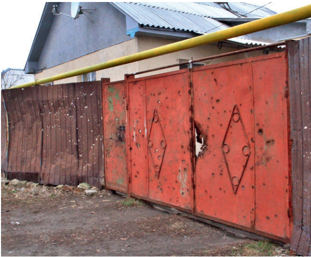
Улица в Станице Луганской, Луганская область

Данные зоны схожи между собой по площади, так как разведение сил предполагает зеркальный отвод ВСУ и пророссийских военных формирований так называемых «ДНР» и «ЛНР» на участках, как правило, 2х2 километра. Однако, все три зоны разведения отличаются ландшафтом, а также количеством гражданского населения проживающего в каждой из них.