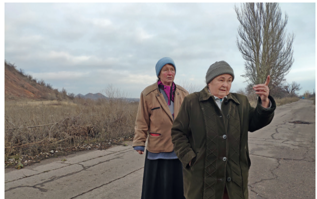
Жительницы Марьинки, Донецкой области

Пески – пригород Донецка, расположенный в «красной зоне» возле разрушенного Донецкого аэропорта. Две тысячи жителей вынуждены были бежать из поселка, и сейчас там остались лишь 11 пожилых людей, отказавшихся эвакуироваться. Люди в Песках не получают пенсий, в поселке отсутствуют транспорт и все государственные службы. В случае чрезвычайных ситуаций жители могут полагаться только на военных и на общественные организации, находящиеся там. Поселок Пески почти полностью уничтожен в результате непрекращающихся военных действий. Несмотря на риск, многие его жители обращаются к властям за разрешением на возвращение.