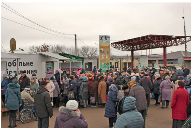
КПВВ Станица Луганска, Луганская область

Улучшение условий и упрощение процедур провоза товаров отмечают и мелкие предприниматели, занимающиеся транспортировкой малых партий (до 75 килограммов) продуктов и бытовых товаров из Станицы Луганской на неподконтрольную территорию. По их словам, большинство произвольных ограничений, которые ранее мешали им работать, были сняты Постановлением