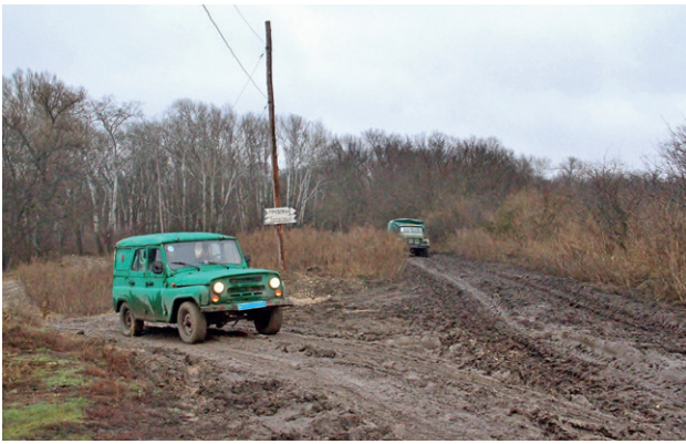
Дорога из Крымского на понтонную переправу