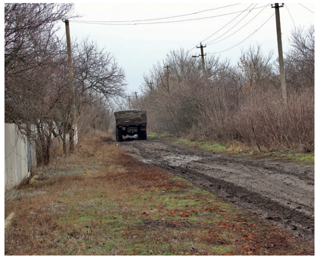
Улица в п. Богдановка, Донецкой области. Участок разведения №3

Вторая зона разведения включает в себя большую часть села Катериновка (86 домов и 150 жителей, из них 7 детей), которое до конца 2017 года находилось в «серой зоне», т. е. полностью не контролировалось ни одной из сторон конфликта. Данное село расположено в непосредственной близости к городу Золотое и одноимённому КПВВ, который был открыт украинской стороной еще в 2016 году, но его работа до сих пор блокируется представителями самопровозглашенной «ЛНР», что делает невозможным пересечение линии соприкосновения в данном месте. Зона разведения также частично проходит по дороге, ведущей от КПВВ до одного из районов города Золотое, поселку шахты «Родина» (Золотое-4).