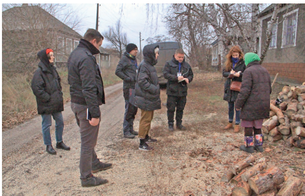
Участники миссии общаются с жительницей п. Лопаскино, Луганская область