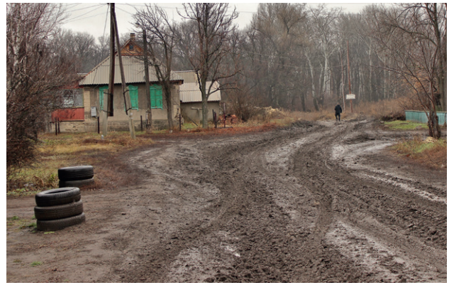
Дорога из Крымского на понтонную переправу