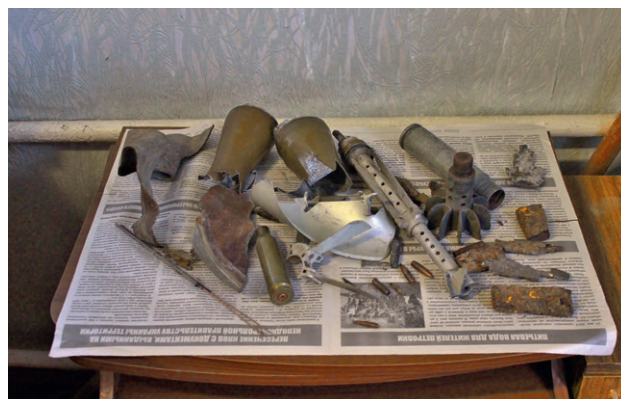
Стол в кабинете Главы ВГА Крымского, Луганской области

Жители Марьинки, Крымского и Трехизбенки говорят, что обстрелы бывают нечасто, однако в Песках люди почти ежедневно слышат отголоски военных действий. Впрочем, жилые дома, по-видимому, попадают под обстрел очень редко. По словам местных жителей, последний случай попадания снарядов в жилые дома в Песках произошел 14