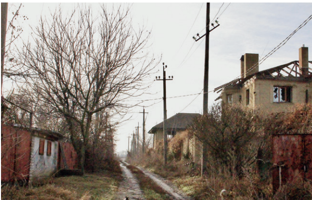
Одна из улиц поселка Пески, Донецкой области