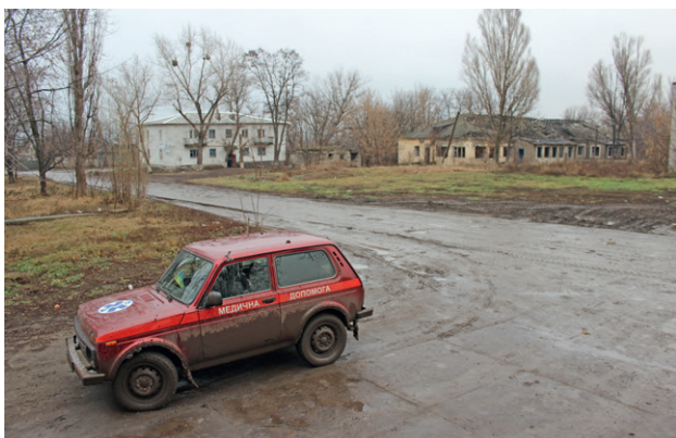
Поселок Крымское, Луганская область

Несмотря на плохие дорожные условия, в обоих населенных пунктах нормально снабжаются