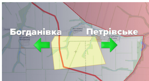
Участок разведения сторон №3 в Богдановке и Петровском

так называемых «Донецкой народной республики» («ДНР») и «Луганской народной республики» («ЛНР»).