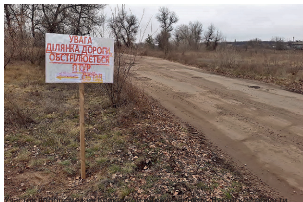
Участок дороги между Крайковкой и Демилитаризованной зоной Луганской области.

Что касается Станицы Луганской, то жизнедеятельность поселка регулируется не только длиной светового дня и риском обстрелов, приходящимися в основном на темное время суток, но и часами работы КПВВ: с 8 до 17 часов в зимнее время.